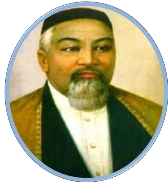
Абай Кунан баев (1845-1904)

Нам бы понять, что блага души несравненно выше телесных, и подчинить плотские потребности велению души.