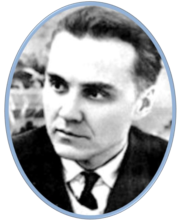
Василий Александрович Сухомлинский (1918-1970)

...Надо по крупицам накапливать интеллектуальное богатство и педагогическую мудрость воспитателя...